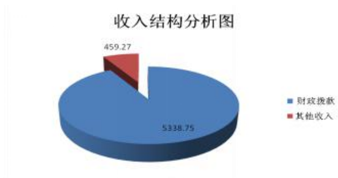
图 1: 收入决算图